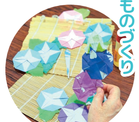
季節にあった作品作り