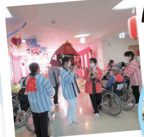
みんなで「わっしょい わっしょい」