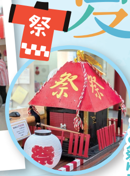
盛り上がりを見せるお祭り