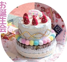
毎月お誕生会を開催。 患者さまをお祝っています