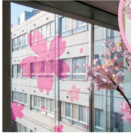
春はお花見 病棟一面がピンク色