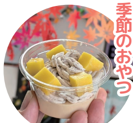
栄養士さんをお願いして 作ってもらったモンブランプリン