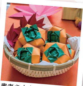
患者さまも職員も 一生懸命作りました!