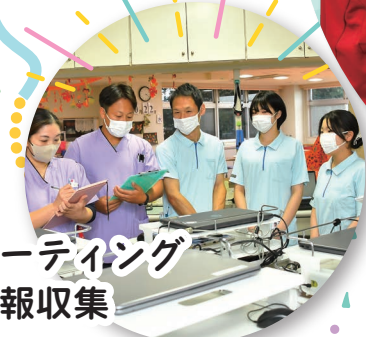
ミーティング 情報収集