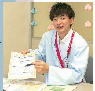
社会福祉士さん (医療ソーシャルワーカー)

患者さまのもとへいち早く向かい、適宜対応している姿と的確に状態を伝えてくれ助かっています。患者さまを思い行動している姿、尊敬しています。