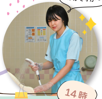
入浴介助・シーツ交換