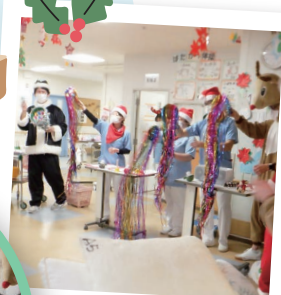
みんなで練習した ハンドベル