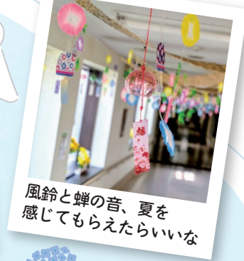
風鈴と蝉の音、夏を 感じてもらえたらいいな