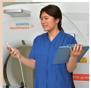
診療放射線技師さん

病棟でのポータブル撮影の際、忙しいなか体位変換を手伝ってくれたり、患者さまの状態や注意点を教えてくださいるのでいつも安心して撮影ができています。