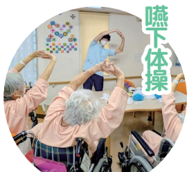
食事前には嚥下体操を実施