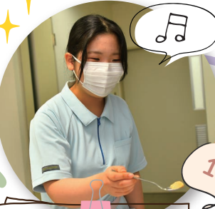
食事介助・口腔ケア