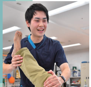
理学療法士さん (リハビリテーション)

入浴やトイレなど日常生活のサポートを丁寧に行ってくださいとても助かっています。普段の様子もこまめに伝えてくださるので安心です。