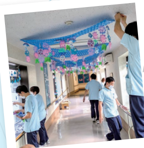
紫陽花と雨 梅雨の時期のお楽しみ