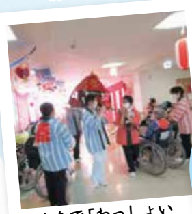
みんなで「わっしょい わっしょい」