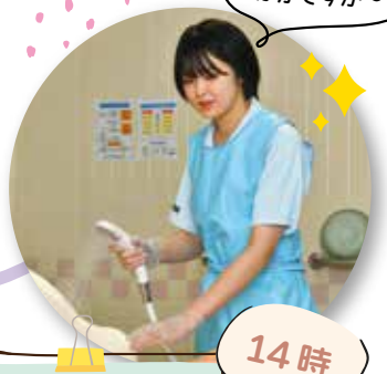
入浴介助・シーツ交換