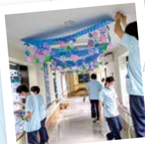
紫陽花と雨 梅雨の時期のお楽しみ