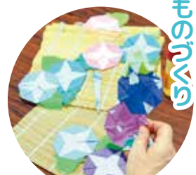
季節にあった作品作り