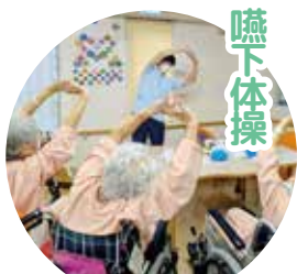
食事前には嚥下体操を実施