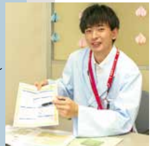
社会福祉士さん (医療ソーシャルワーカー)

患者さまのもとへいち早く向かい、適宜対応している姿と的確に状態を伝えてくれ助かっています。患者さまを思い行動している姿、尊敬しています。