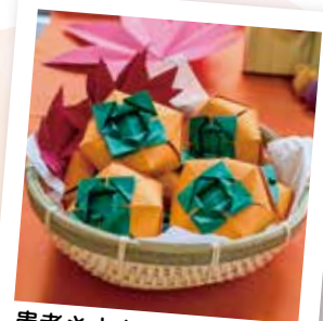
患者さまも職員も 一生懸命作りました!