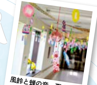
風鈴と蝉の音、夏を 感じてもらえたらいいな