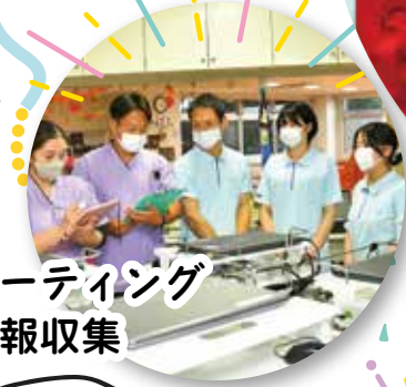
ミーティング 情報収集