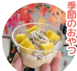
栄養士さんをお願いして 作ってもらったモンブランプリン