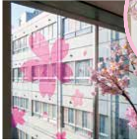
春はお花見 病棟一面がピンク色