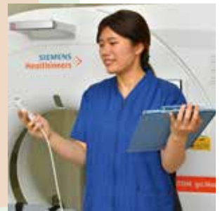
診療放射線技師さん

病棟でのポータブル撮影の際、忙しいなか体位変換を手伝ってくれたり、患者さまの状態や注意点を教えてくださいるのでいつも安心して撮影ができています。