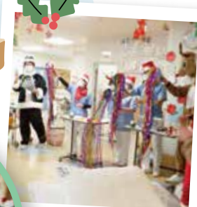
みんなで練習した ハンドベル