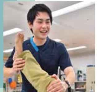
理学療法士さん (リハビリテーション)

入浴やトイレなど日常生活のサポートを丁寧に行ってくださいとても助かっています。普段の様子もこまめに伝えてくださるので安心です。