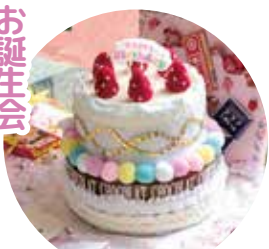
毎月お誕生会を開催。 患者さまをお祝っています