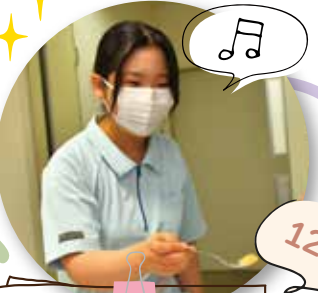
食事介助・口腔ケア