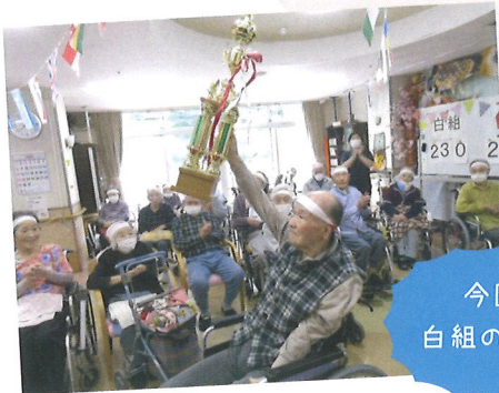
今回は 白組の勝利!!