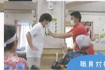
職員対抗 押し相撲