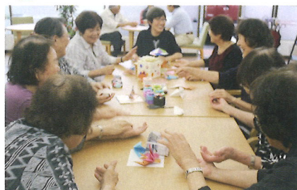
写真はコロナ禍以前の活動の様子です。