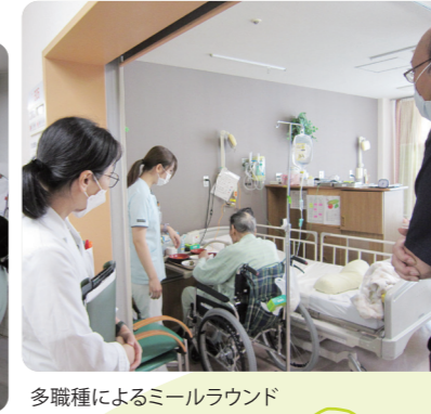
多職種によるミールラウンド