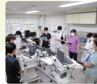
摂食支援チームの様子

より良い医療の提供を目指し、多職種協働で行う院内の各種ラウンドやカンファレンスに参加しています。医師、歯科医師、看護師、薬剤師、理学療法士、作業療法士、言語聴覚士、介護福祉士、ソーシャルワーカー等と連携・協働し、多角的な視点からご利用者のQOL向上、穏やかな療養生活の実現を目指して活動しています。