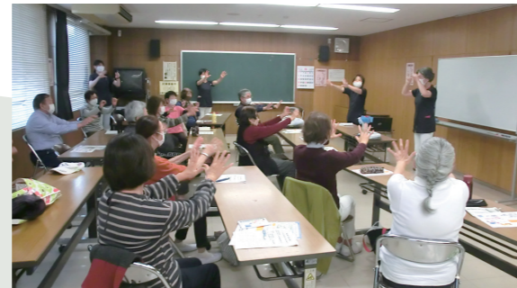
▲「フレイル予防」への理解を深めた楽しいイベントとなりました。

今年も、介護老人保健施設大宮ナーシング・ピアは地域の皆さんのお役に立てるさまざまな健康づくりに関する取り組みを実施していきます。