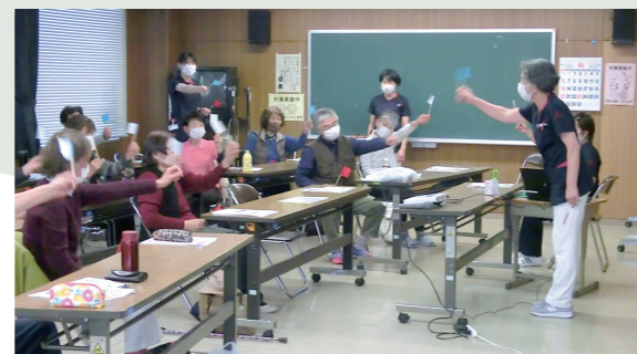
▲ゲーパーをしながら足踏みをしたり、3と5の倍数で旗あげしながら足踏みをしました。