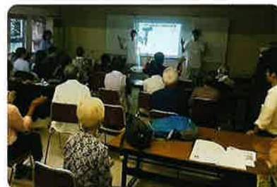
公民館での認知症予防体操(コグニサイズ)の実践