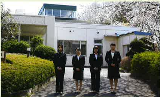
社会福祉法人欣彰会 4名