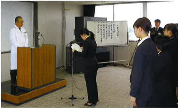
新入職員代表による誓いの言葉