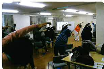
老人クラブでの介護予防体操の実践