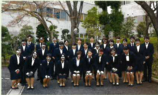
医療法人財団新生会 28名