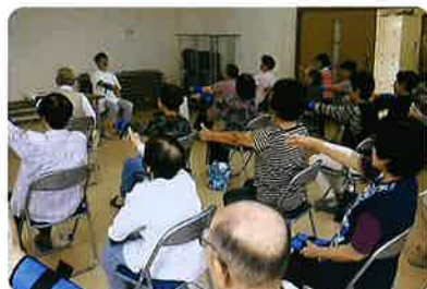
自治会での介護予防体操(いきいき百歳体操)の実践