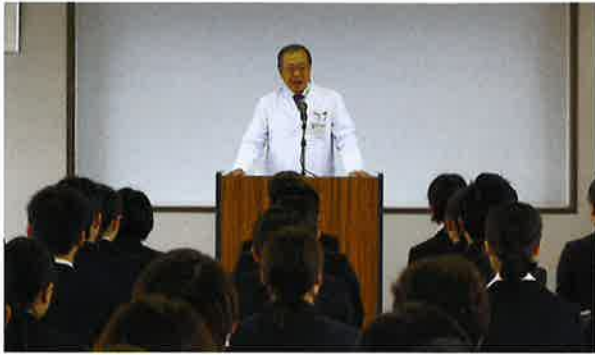
漆原理事長の挨拶