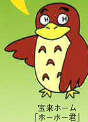
宝来ホーム 「ホーホー君」

ゆったりと開放的で、一人ひとりがそれぞれ好きなように過ごされています。レクリエーション等が行われる時は皆が集まり、賑やかな空間になります。