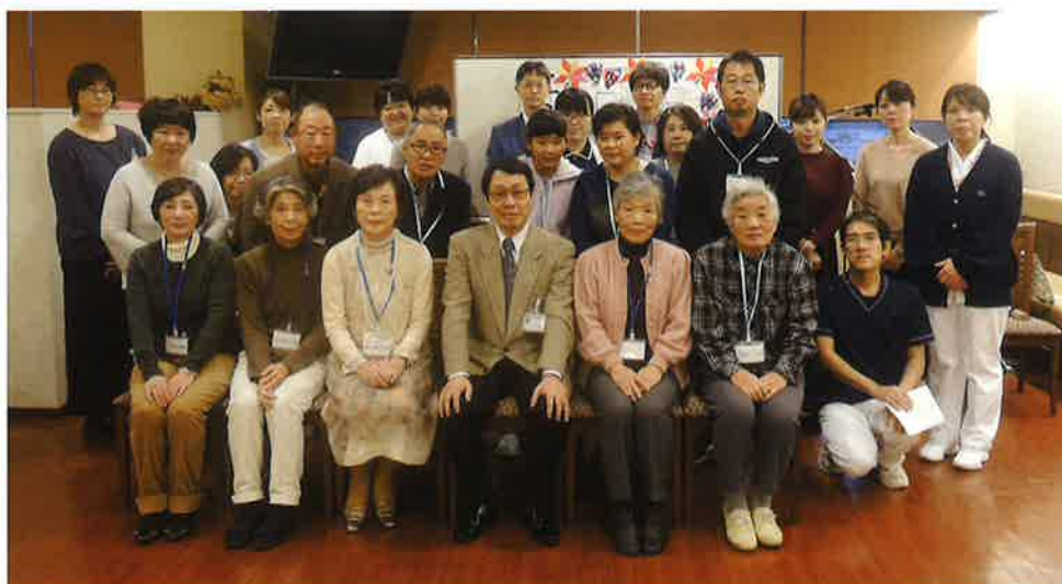
*写真掲載にあたり、ご家族様の了解を頂いております。

今回ご都合で参加できなかった方々からもたくさんのお手紙をいただき、皆様それぞれに新しい日々を過ごされていることが伺えました。また、スタッフに対するありがたい励ましのお言葉も多く、感謝しています。