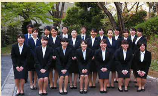
医療法人財団新生会 21名