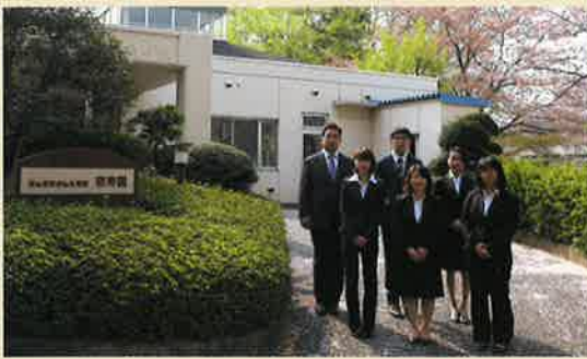
社会福祉法人欣彰会 6名