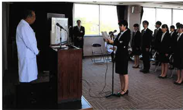
新人職員代表による誓いの言葉