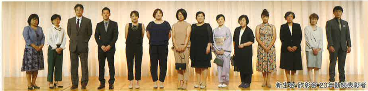
新生会 欣彰会 20年勤続表彰者