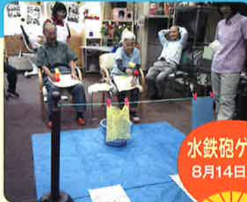
水鉄砲ゲーム 8月14日(火)