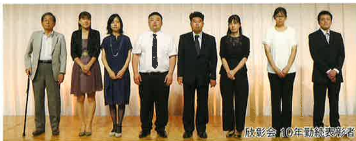
欣彰会 10年勤続表彰者