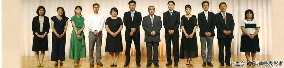
新生会 10年勤続表彰者