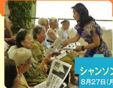
シャンソン 8月27日(月)