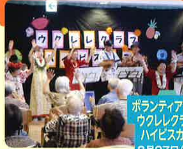
ボランティア行事 ウクレレクラブ ハイビスカス 8月27日(月)