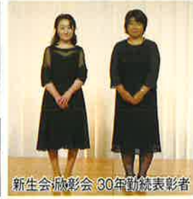
新生会 欣彰会 30年勤続表彰者