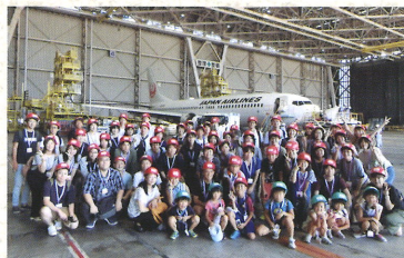
2018年7月 日帰り旅行：JAL工場見学