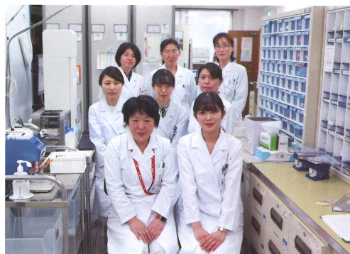
薬剤部スタッフ一同

薬剤部では、当院の理念である「良質な医療の提供と地域社会への貢献」のために、医薬品が効果的かつ安全に使用され、患者様が安心して地域で過ごしていただけるように日々努めています。特に超高齢社会を迎え地域の中核病院として、当院では亜急性期から回復期・慢性期、在宅医療へと幅広い対応が求められています。薬剤部スタッフは、この時代の要請に応えるために日々研鑽に努め、専門知識や専門技術の習得はもちろんのこと、チーム医療の実践を通じて、他の医療スタッフと協力し地域医療に貢献したいと考えています。薬剤部内ではスタッフ間の意見交換を密にし、互いに働きやすい環境づくりに努めています。