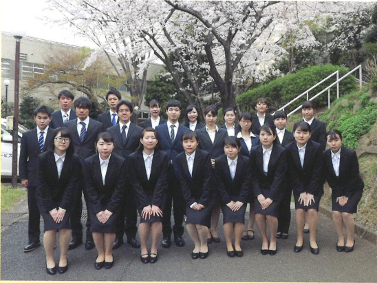
医療法人財団新生会 22名