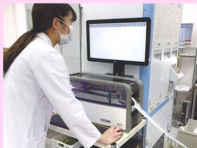
錠剤監査システム