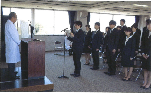
新入職員代表による誓いの言葉