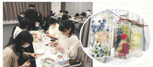
2019年1月 カルチャー教室：ハーバリウム

平成31年4月1日、大宮共立病院グループでは、たくさんの方の新たな職員を迎えて、新年度がスタートしました。また、この日は、平成に続く新たな元号は「令和」と発表され、歴史的な一日となりました。「令和」には「人々が美しく心を寄せ合う中で、文化が生まれ育つ」という意味が込められているそうです。平成最後、そして、新しい時代が幕を開ける節目の年。希望に満ちた飛躍の年となるよう、気持ちを新たに日々の業務に邁進してまいります。 編集員一同、これからも皆様のお役に立てる情報をお届けできるよう取り組んでまいりますので、どうぞよろしくお願い致します。