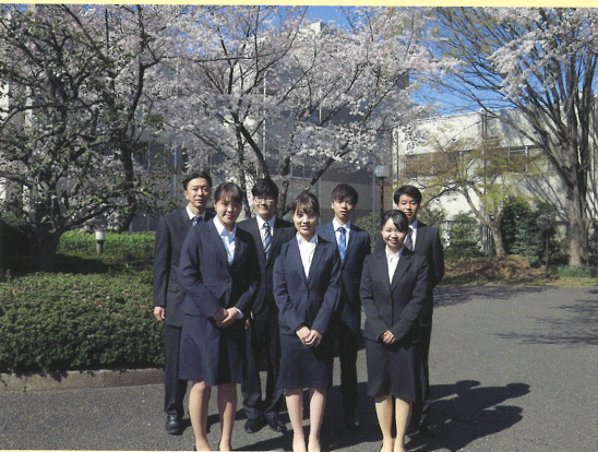
社会福祉法人欣彰会 7名