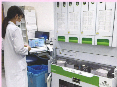
全自動錠剤・散薬分包機

主に入院患者様の内服薬・外用薬の調剤、注射薬の調剤・無菌調製を行っています。当院は高齢者が多いことから、院内調剤は全て一包装しています。全自動錠剤・散薬分包機や最新の錠剤監査システムなどを導入し、調剤の効率化・安全性の確保に努めています。経管投与の患者様に対しては、2003年から「簡易懸濁法」を取り入れ安全な薬物治療に寄与しています。