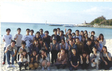
2018年11月 一泊旅行：沖縄