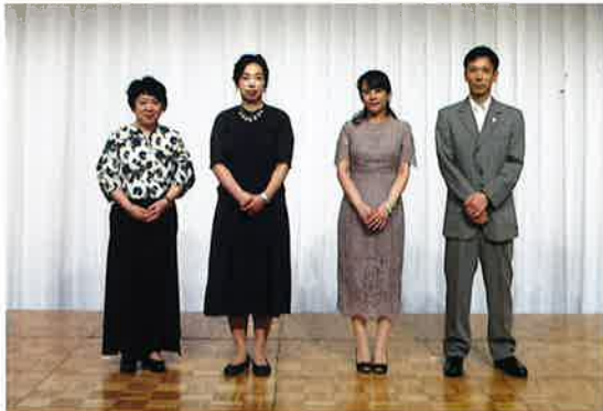
新生会・欣彰会 30年勤続表彰者