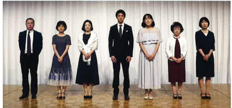
新生会 20年勤続表彰者