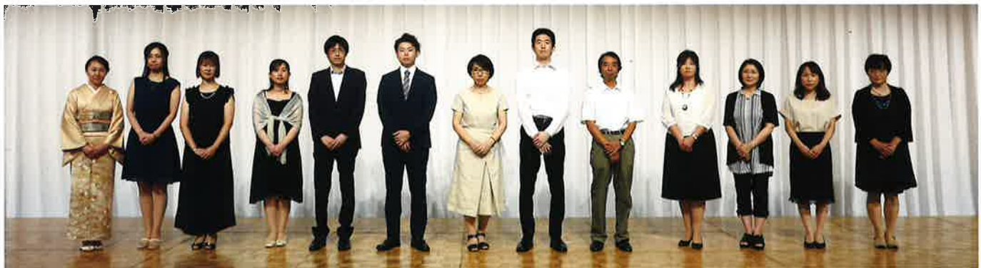
新生会 10年勤続表彰者