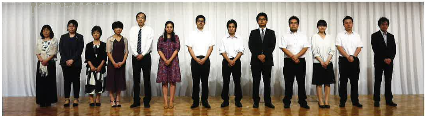
欣彰会 10年勤続表彰者