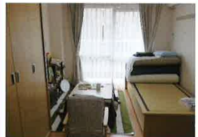
住みやすい広さの個室