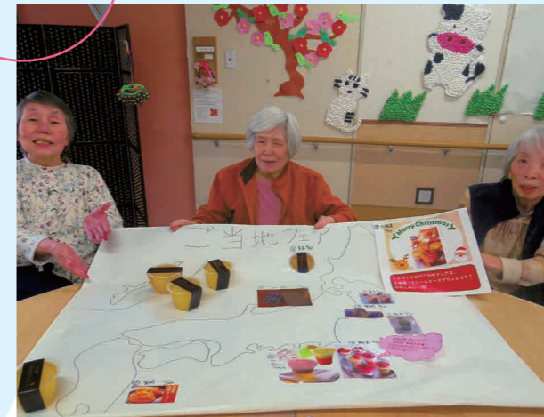
2月は青森の「雪貯蔵りんごゼリー」をいただきました