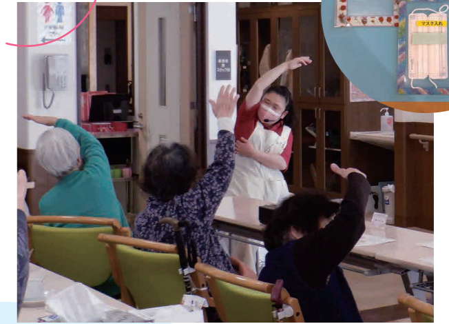
ワイヤレスマイクを使用した体操