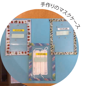
手作りのマスクケース