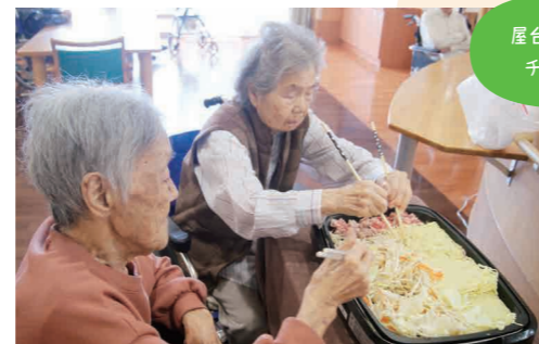
屋台メニューに チャレンジ!