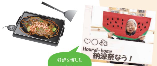
好評を博した フォトアース