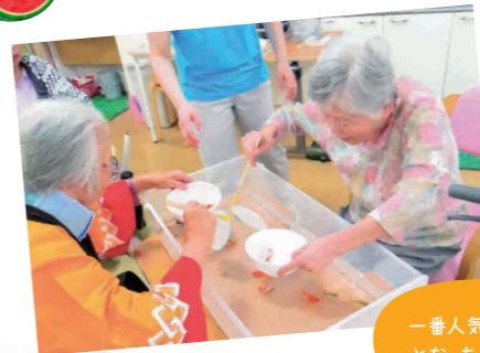
一番人気のイベント となった金魚すくい