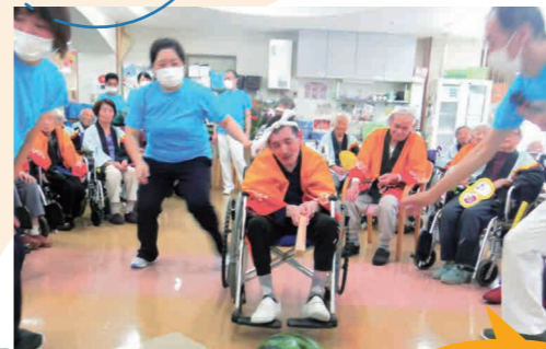
盛り上がった スイカ割り

午後の演目は縁日。目玉は射的で、職員が割りばしや輪ゴム、段ボールを駆使して作成しました。人気の金魚すくいはご利用者様が口々に「自分ですくった金魚を持って帰りたい!!」と話されていました。綿あめを口いっぱい頬張り、ジュースやスイカをいただいとお腹いっぱいになったりと、童心にかえって楽しまれた様子でした。