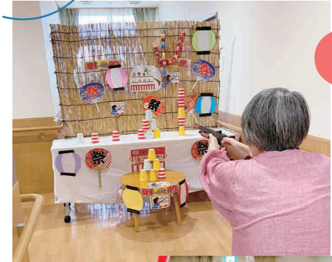
集中して賞品を狙う ご利用者様

そうした中、施設全体の新しい取り組みとして「Zoom」を用いたくじ引き大会が行われました。大型テレビやプロジェクターに番号が映し出されると、ご利用者様全員がご自分の番号と見比べ、とても盛り上がりました。「ご利用者様を楽しませるために、自らも楽しむ」をモットーに職員全員が一丸となった日でもありました。