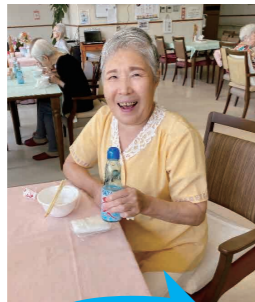
「喫茶心太」で 振る舞われた瓶ラムネ

7月24日に園内のみで開催された敬寿園納涼会は午前と午後に縁日を開きました。ケアハウスみたがいではこの日限定の「喫茶心太」がオープン。ところてんの酢醤油味と黒蜜味の食べ比べが行われ、酢醤油に軍配が上がりました。また、デイサービスでは8月16日から21日にかけて清涼行事としてかき氷をおやつに提供。ご利用者様からは「懐かしいねえ〜。何年ぶりかな」「夏らしく風情があっていいね」とのお声が聞かれ、涼しさ、懐かしさを満喫した夏のイベントとなりました。