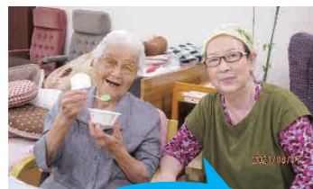
大好評だった かき氷イベント