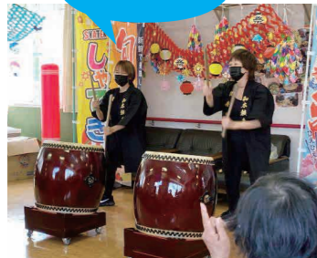
午後の部では 敬寿園太鼓同好会が 太鼓を演奏

欣彰会恒例の納涼イベントが今年も各施設で開催されました。テーマに沿った催しのほか、Zoomを使ったくじ引きなど新たな工夫も見られ、どの施設もご利用者様、職員ともにコロナを吹き飛ばす笑顔あふれる一日となりました。