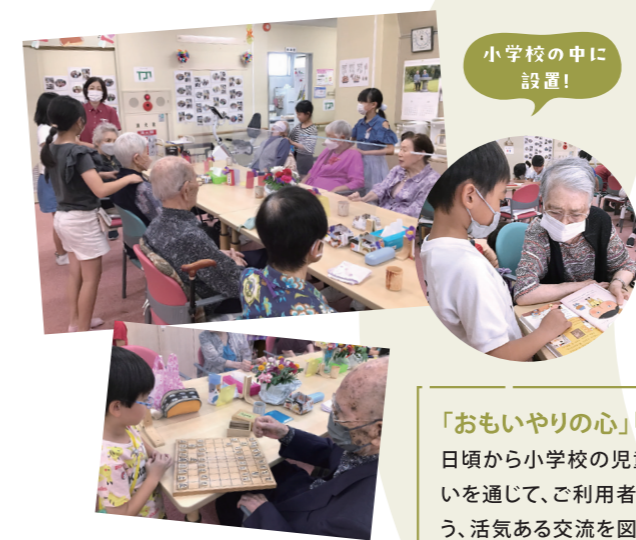
小学校の中に設置!