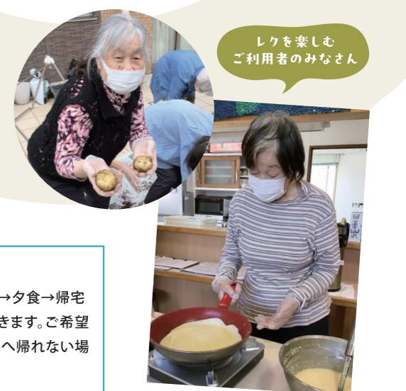
レクを楽しむ ご利用者のみなさん