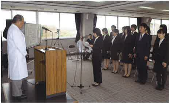
新入職員代表による誓いの言葉