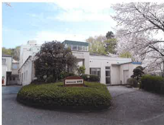
高齢者総合福祉施設 敬寿園

我が国の人口減少社会や、本格的な超高齢化社会はこれからが本番を迎えます。国の高齢者施策も、私達に求められる課題もこれまで以上に変化するでしょう。この創立30周年を機に心新たに尽力して参りますので、これまで以上のご指導、ご支援を頂きますよう心からお願い申し上げます。