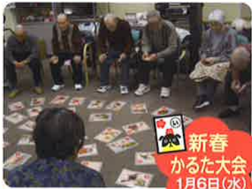
新春 かるた大会 1月6日(水)