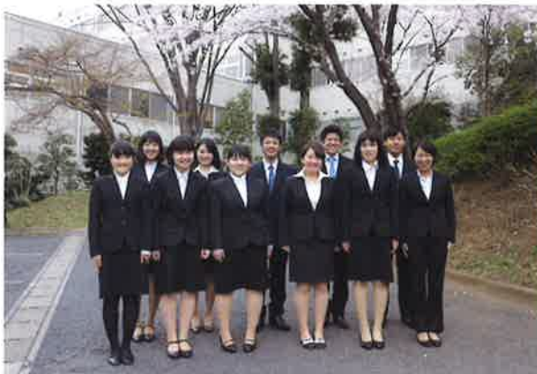
医療法人財団新生会 11名