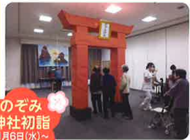
のぞみ 神社初詣 1月6日(水)~ 1月9日(土)