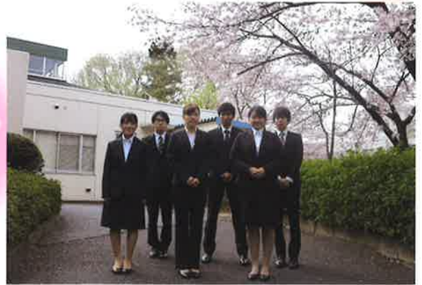
社会福祉法人欣彰会 6名