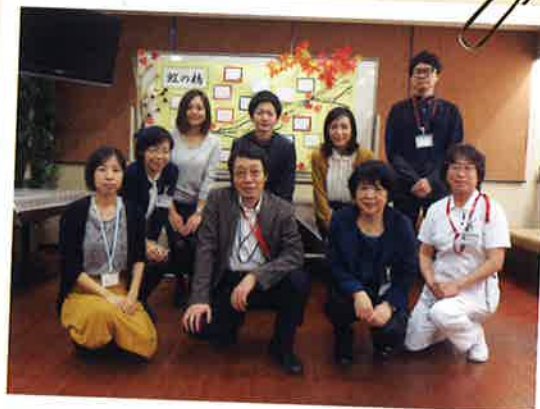
緩和ケア委員会スタッフ一同 ※11月7日(土)家族会にて