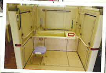
入浴シミュレーター

また、退院後を想定した福祉用具の導入や住宅改修の提案を目的に、入院中にご自宅にうかがう家屋訪問や、公共交通機関を使つての外出練習等も今までに引き続き積極的に行っています。